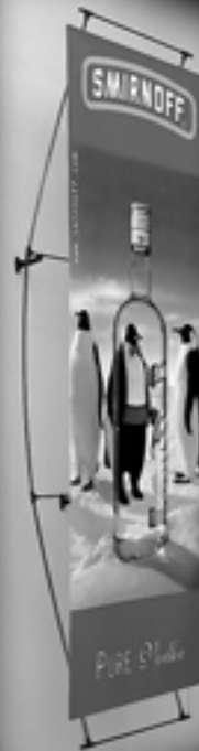
mural ou suspendu