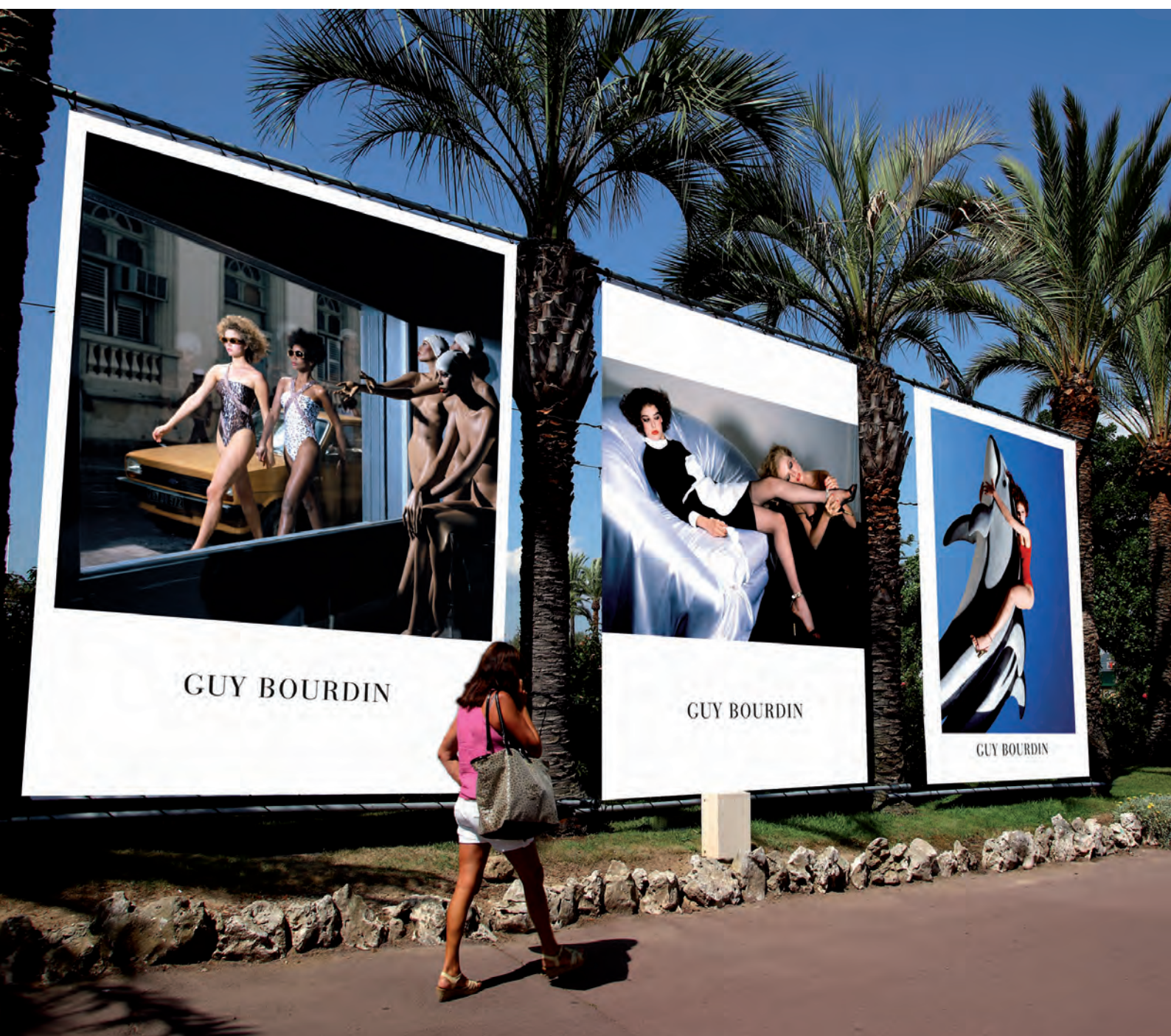
2009. Guy Bourdin, hommage lors du 7 e Festival

With each edition, a great photographer is invited and exposed in very large format (3 x 5 m) in the gardens of the palmeraie Roseraie, an exceptional natural site that accentuates the beauty of the exposed photographs.