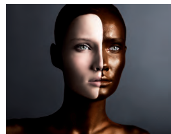
15. Straulino (Allemagne)