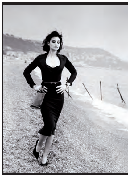
5. Monica Bellucci, / Elle France