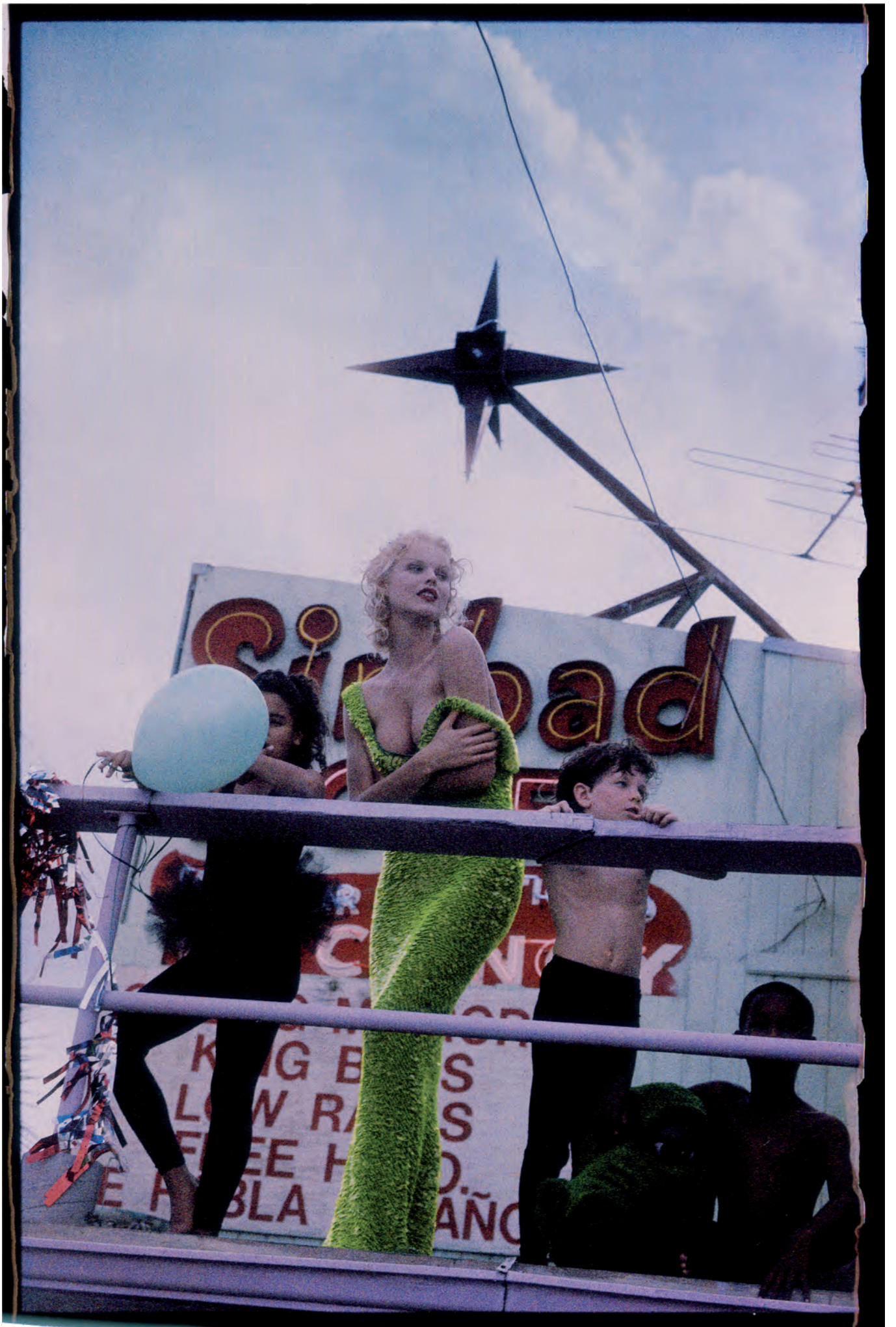
Eva Herzigova, 1995