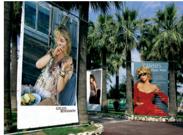
2007. Gilles Bensimon, invité du 5 e Festival