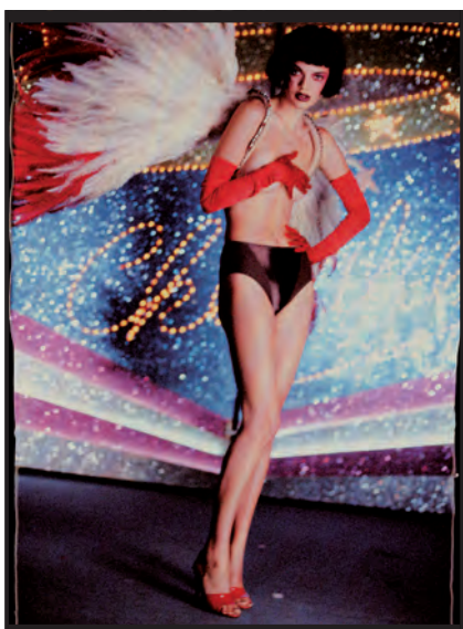
1. Alice, 1997 / Elle France

E-mail : tordjman.ruth@free.fr Download the press informations on www.festivalphotomode.com