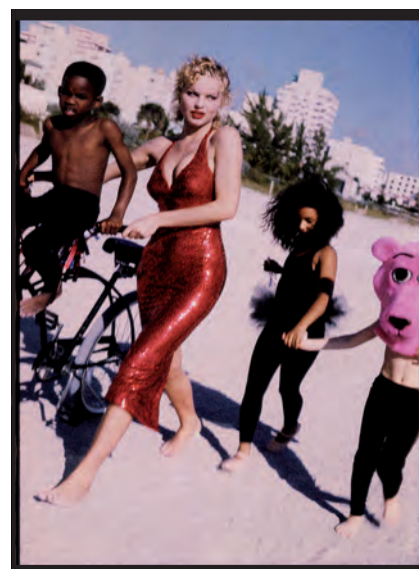
3. Eva Herzigova, 1995 / Marie-Claire Italie