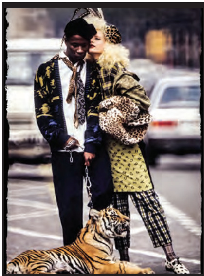
4. Campagne mondiale Mexx, 1985-1988