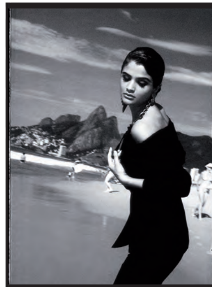
6. Helena Christensen, 1992 / Marie-Claire France