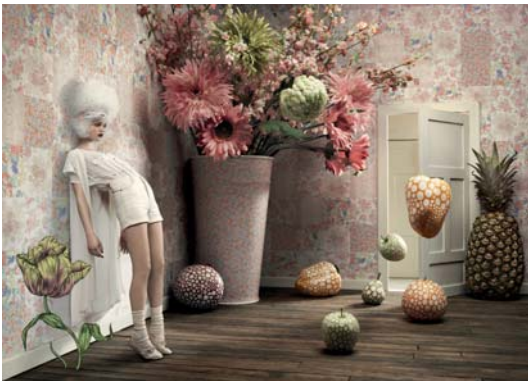
16. Aorta (Suède)