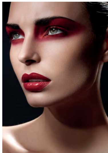
8. Davolo (Suisse)